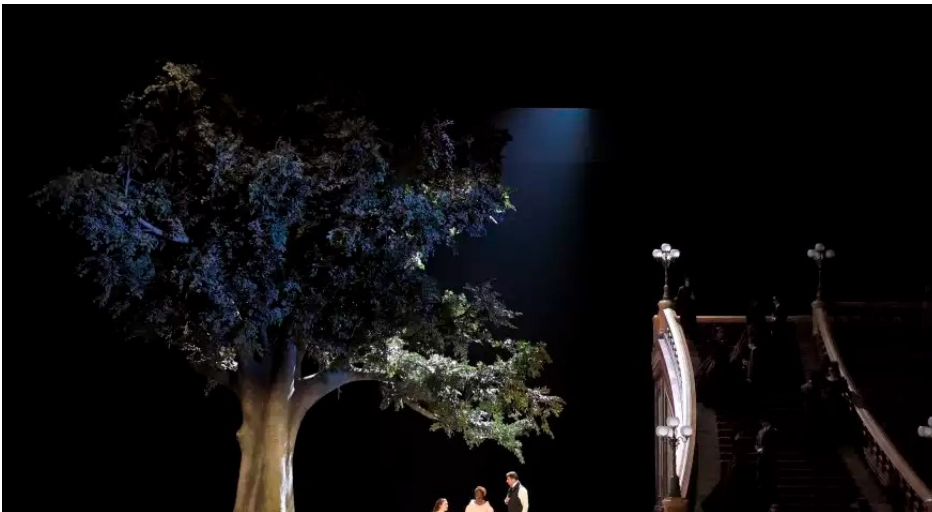
Foto della monumentale Traviata di Benoît Jacquot all'Opéra Bastille