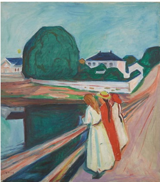
Munch; il grido interiore